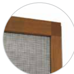
Ramka z narożnikiem zewnętrznym w wersji z bocznym doszczelnieniem.