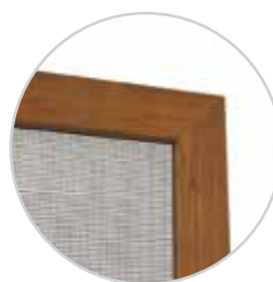
Ramka z narożnikiem wewnętrznym.