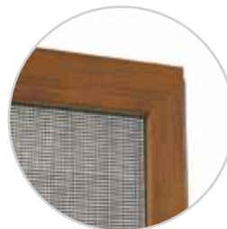
Ramka z narożnikiem wewnętrznym w wersji z bocznym doszczelnieniem.