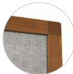
Ramka z narożnikiem zewnętrznym tworzywowym.